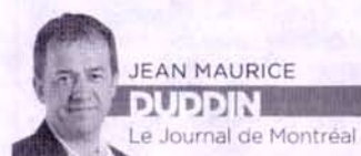
JEAN MAURICE DUPPLIN Le Journal de Montréal

MONT-TREMBLANT | Une nuit à 1 000 $ à Tremblant, dans un condo hyper luxueux de trois chambres de 1,5 million de dollars, avec les billets de ski déjà imprimés, les skis loués bien alignés dans le garage, l'épicerie rangée dans le réfrigérateur, le cellier rempli, le bois préparé pour le foyer, les téléviseurs à écran plat, le Wi-Fi, le spa privé, le garage chauffé, le chef cuisinier disponible sur demande.